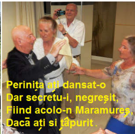
Perința ați dansat-o Dar secretu-i, negreșit, Fiind acolo-n Maramureș, Dacă ați si țâpurit.