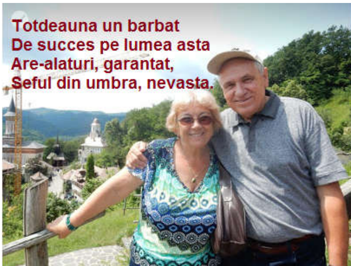
Totdeauna un barbat De succes pe lumea asta Are-alaturi, garantat, Seful din umbra, nevasta.