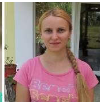
Anca Nora mea